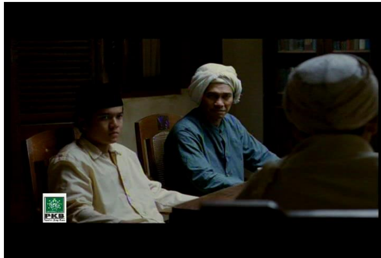
Gambar 2. Contoh jihad lisan

Ketiga pada scene 9 ( disc 1 menit ke- 00:20:33) Terlihat salah sorang putra Kiai yang berani melawan tentara jepang dengan mengibarkan bendera merah putih dan mengucapkan kalimat Allahu Akbar.