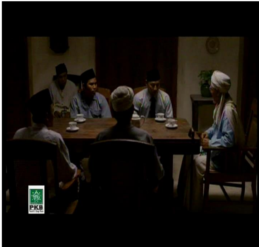
Gambar 8. Contoh jihad lisan

penjajah adalah jihad fi sabilillah. Oleh karena itu umat Islam yang mati dalam peperangan itu adalah syahid. Mereka yang mengkhianati perjuangan umat Islam dengan memecah belah persatuan dan menjadi kaki tangan penjajah wajib hukumnya dibunuh.