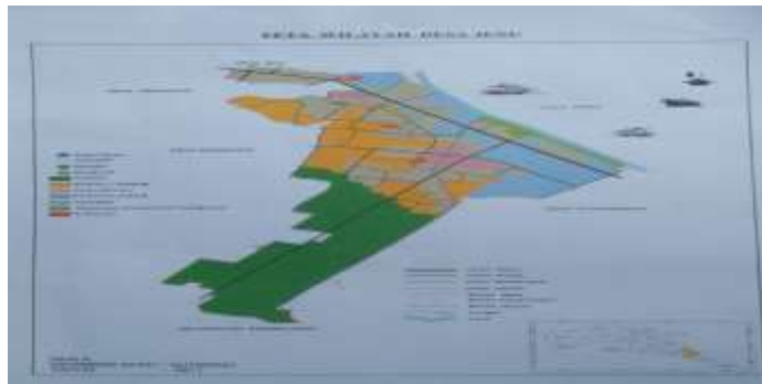
Peta Wilayah Desa Jenu