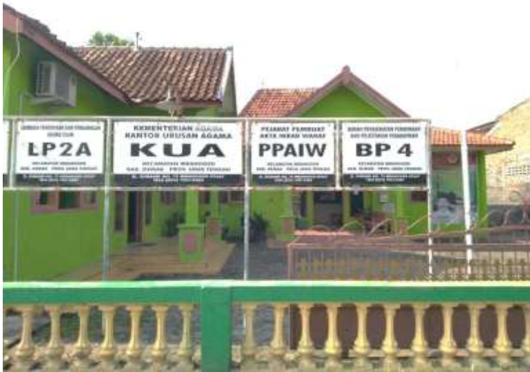
Kantor Urusan Agama (KUA) Kecamatan Mranggen