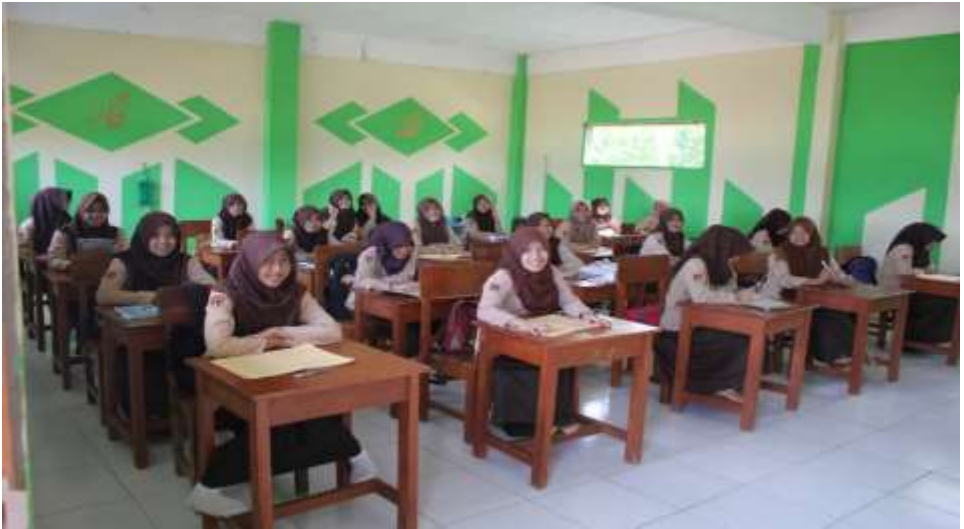
Kegiatan proses pembelajaran di kelas IX putri