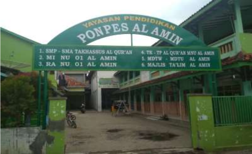
Yayasan Pendidikan Pongpes Al-Amin