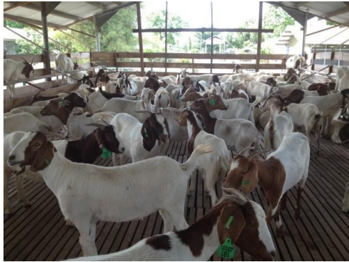
Kelompok usaha ternak Sumber makmur