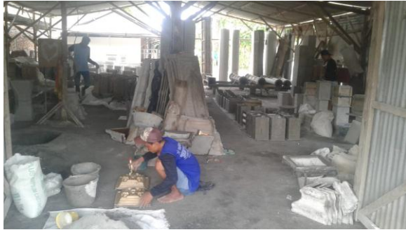
Kelompok usaha beton dan kelontong bata