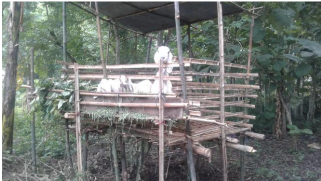
Kelompok usaha ternak Mandiri Sejahtera