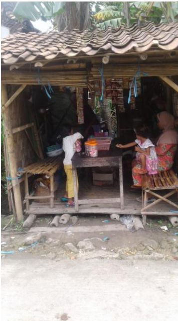
Penerima bantuan pinjaman untuk usaha warung makan dan Gorengan