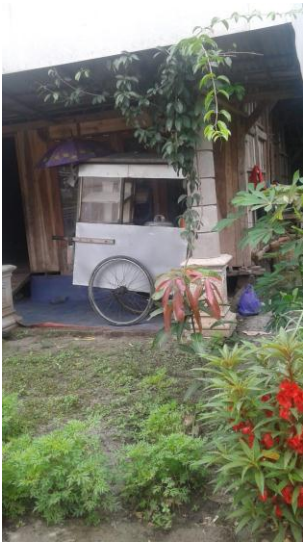
Penerima bantuan pinjaman untuk usaha bakso keliling