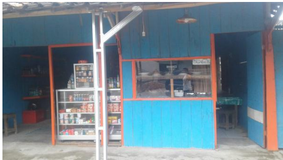
Penerima bantuan pinjaman untuk usaha warung makan